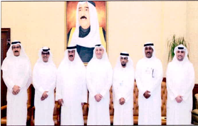
• مسؤولو «بيتك» والتطبيقي