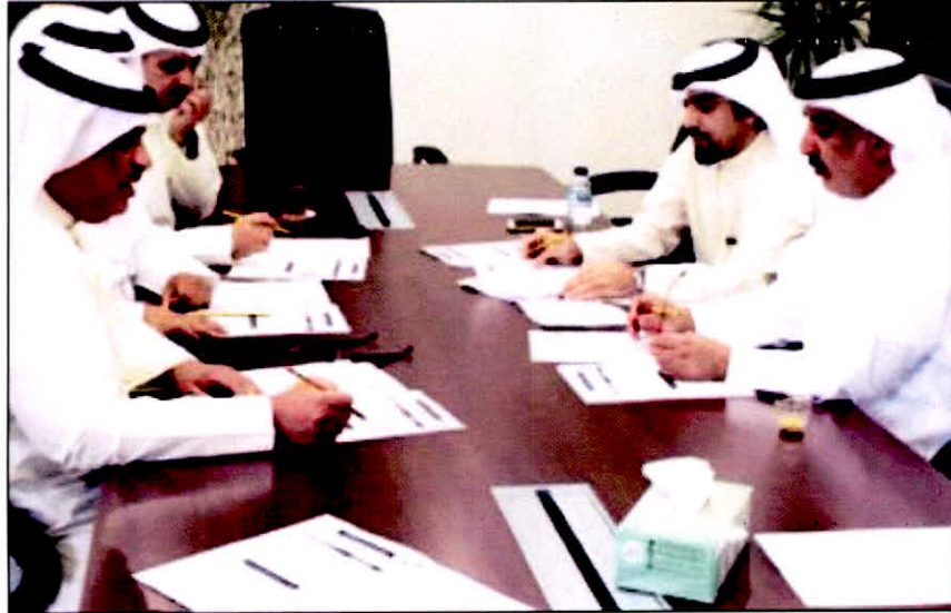
جانب من الاجتماع بين مسؤولي المعهد ووزارة التجارة

«مفتش تجاري» بعد الدراسة لمدة عامين «4 فصول تدريبية + فصل تدريب ميداني» بالتعاون مع وزارة التجارة والصناعة، وقد اطلع الحضور خلال الاجتماع على جميع التحضيرات الخاصة بلجان المقاييل، كما تم التنسيق وتبادل وجهات النظر بين الحضور حول عدد من النقاط التي تهدف الى تنظيم قبول الطلاب المتقدمين وتحديد الكفاءات والمهارات المطلوبة منهم.