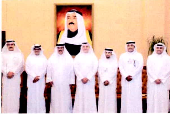
من حفل التوقيع