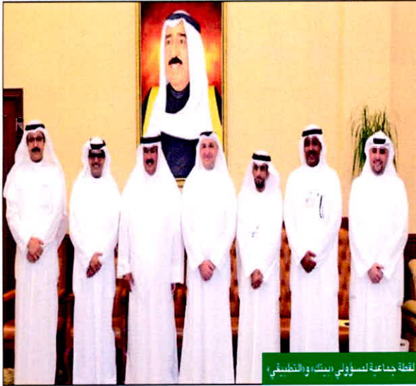
لفظة جماعة لتسولي بيتك، والتطبيقي

الناهض: دعم الطلبة والعملية التعليمية شرطا لتحقيق تنمية شاملة