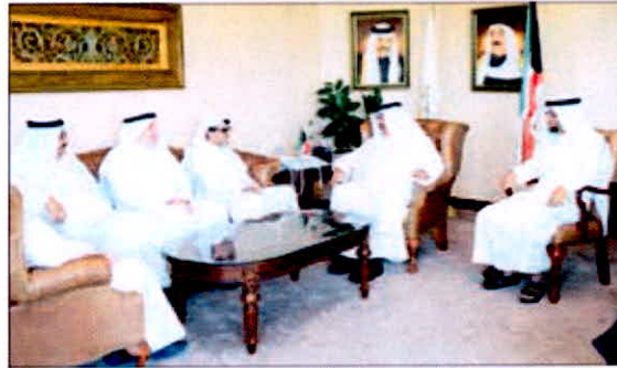
مسؤولو «بيتك» و«التطبيقي» خلال اللقاء

مؤسسة مالية اسلامية رائدة عالمياً وهو «هارفارد» البنوك الاسلامية ومرجع الصيرفة الاسلامية، حيث تخرج فيه كوكبة من لبرز الشخصيات الذين حققوا نجاحات علي اصعددة مختلفة، لافتاً إلى أن «بيتك» يعد من اوائل وأكبر