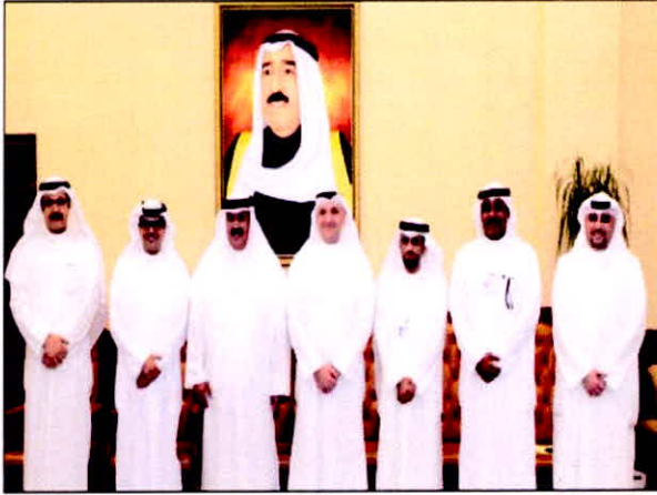
رئيس مجلس إدارة بيتك