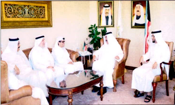
• المناقش والصف وبندي والقرطاس مع مسؤولي الطرفين عقب توقيع الاتفاقية