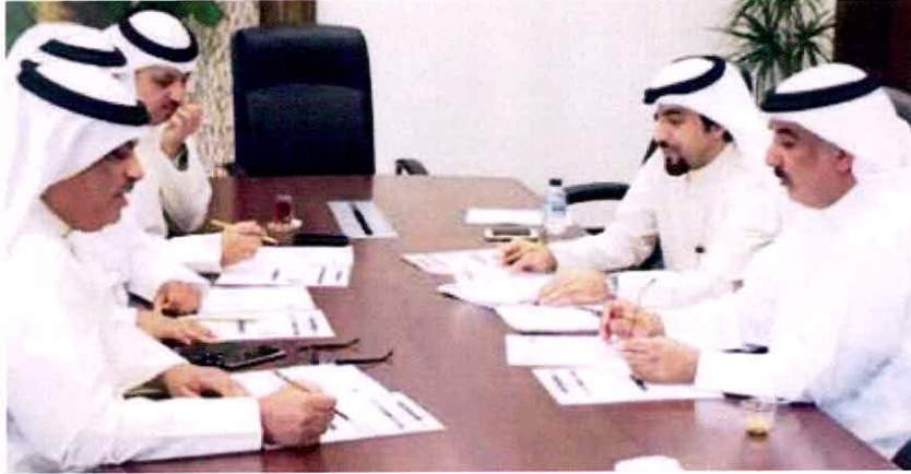
اجتماع معهد العلوم الادارية مع التجارة

الهيئة عمل اللجان المقرر انعقادها الاسبوع المقبل، لقبول دفعة جديدة من الطلبة لتخصص دبلوم «تفتيش تجاري»، الذي يطرح بالمعهد لأول مرة للطلاب الحاصلين على الثانوية العامة، بهدف تخريج «مفتش تجاري» بعد الدراسة لمدة عامين، بالتعاون مع وزارة التجارة والصناعة.